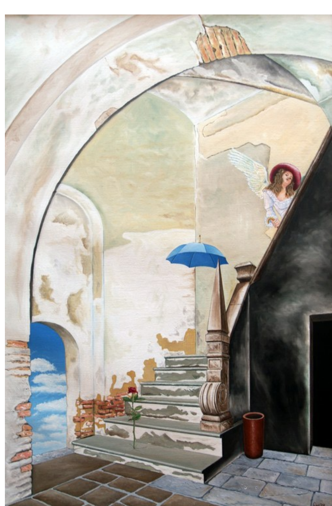
De aankondiging (olieverf)

In de voorgaande eeuwen waren de Rooms-Katholieke Kerk, de hoge geestelijkheid en de adel de grootste opdrachtgevers en afnemers van religieuze kunst. Wat betekende dat voor de kunstenaars, welke spelregels waren er? Onafhankelijk denken/eigen interpretaties werden vaak niet getolereerd door de kerkelijke leiding. Maar er waren trucjes.