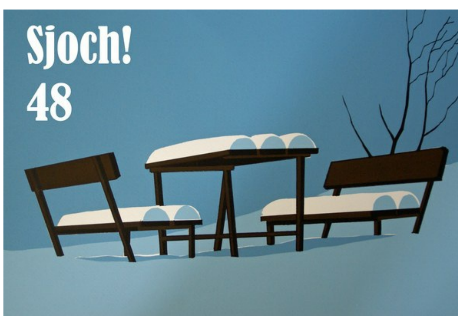
Zeefdruk: picknicktafel in de sneeuw (1 afdruk).